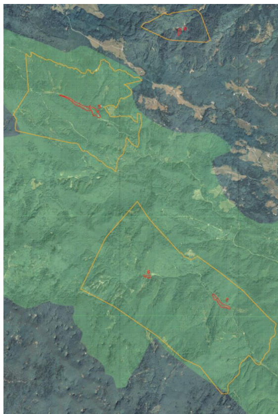
Osrednji del in vplivno območje 4, 5, 6, 7

Po slovenski nacionalni zakonodaji je formalna spomeniškovarstvena zaščita nepremične kulturne dediščine na območju Idrije izvedena na treh ravneh: